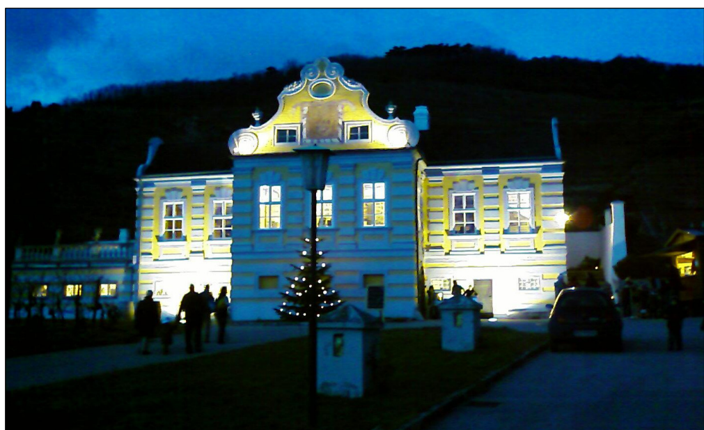
Stimmungsvoll be- und erleuchtet: Das Kellerschlössel der Domäne Wachau im Advent

Wem der Trubel in der Vinothek zu viel werden sollte, der kann sich am Nachmittag durch die barocken Kellerrabyrinthe der Domäne Wachau führen lassen. Dort erfährt man dann alles, was man über die Wachau ganz allgemein und die Domäne im Speziellen schon immer wissen wollte.