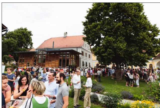
Die 3. Gault&Millau Landpartie verspricht einen kulinarischen Juni-Tag im Grünen.

Dieses Jahr steht die Landpartie unter dem Motto „Gereiftes Österreich“ und widmet sich den zahlreichen, unentdeckten Schätzen in den Kellern heimischer Winzer. Ca. 50 Winzer/innen präsentieren ihre Weine dem fachkundigen Publikum in wunderbarer, paradiesischer Atmosphäre. Wer sein Wissen vertiefen möchte, besucht vor Ort die Workshops von Österreich Wein Marketing.